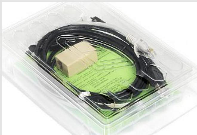
Комплект доработки ШТРИХ-LIGHT-ФР-К, ШТРИХ-LIGHT-ПТК до ШТРИХ-ЛАЙТ-02Ф