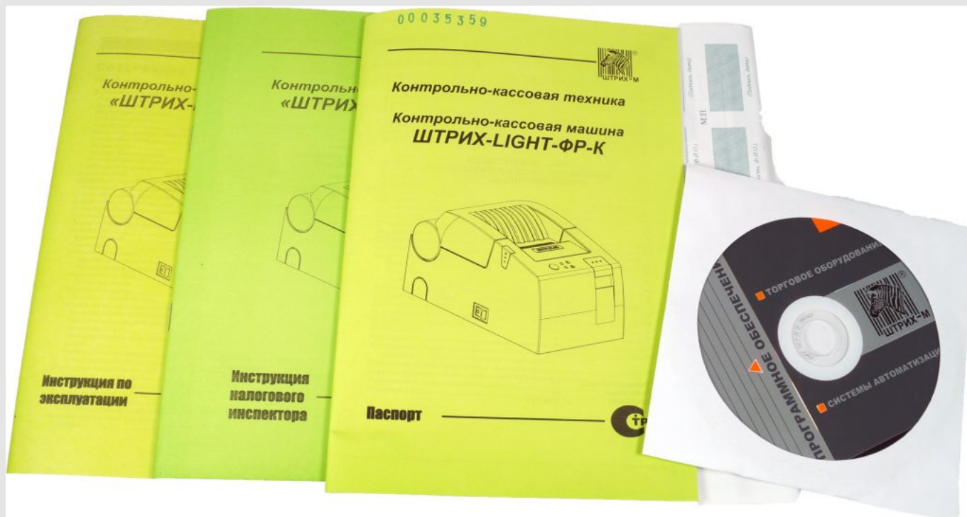
Комплект поставки ШТРИХ-ЛАЙТ-02Ф