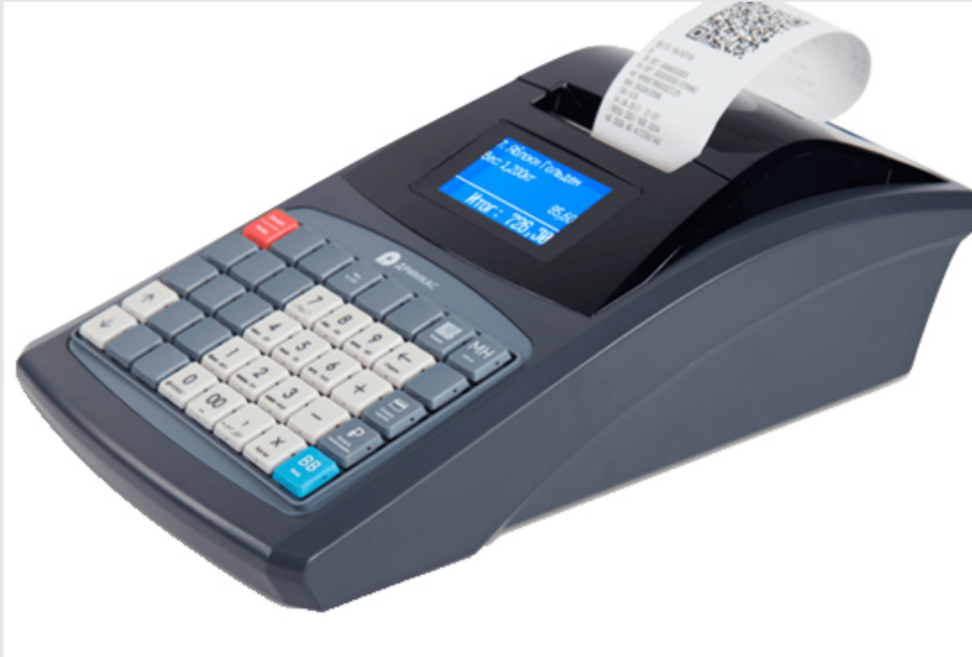
Дримкас Ф вид сверху