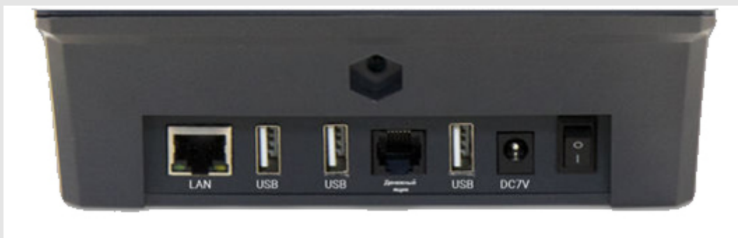
Порты на задней части аппарата

Панель с портами располагается в задней части кассы. Предусматривается наличие всех необходимых для взаимодействия с другим оборудованием разъёмов. Чтобы подключаться к компьютеру используется USB (тип 2.0) порт в количестве 3 штук. Поскольку он является универсальным, допускается подсоединение через него других видов оборудования. Так же, на задней части располагаются порты.