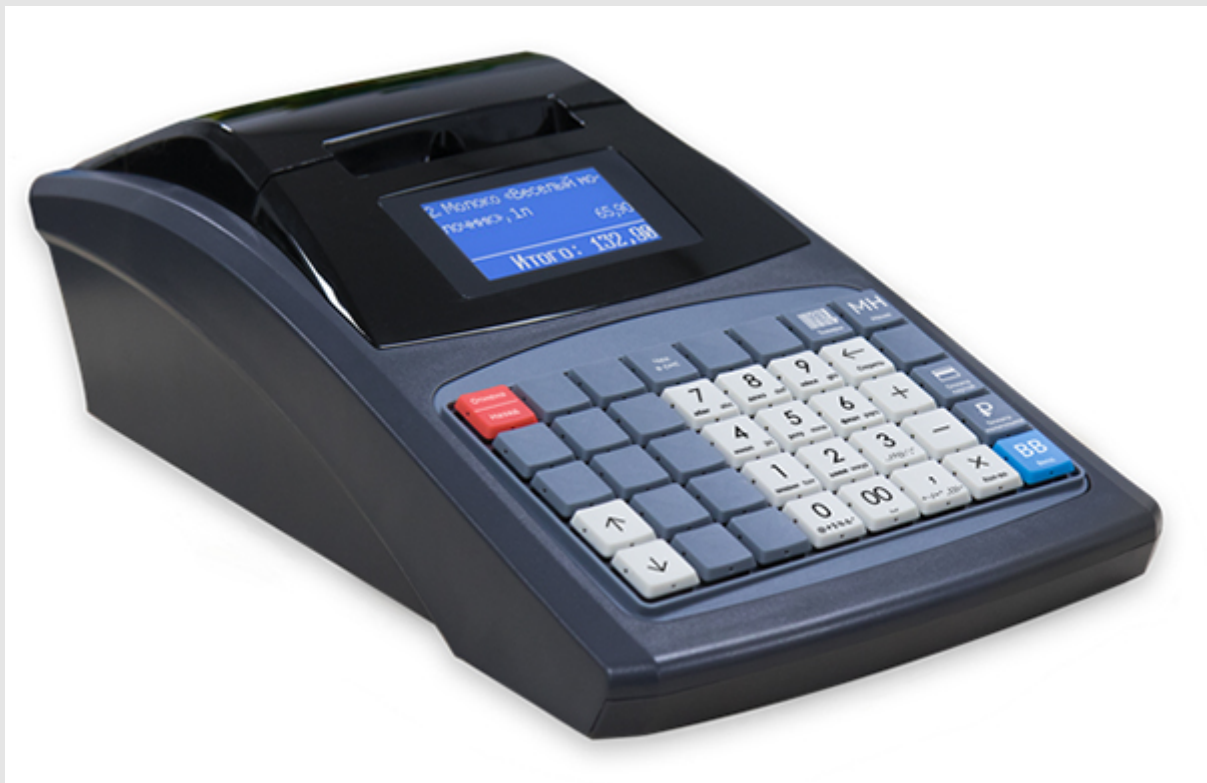
Клавиатура Дримкас Ф

Клавиатура имеет все основные элементы, что не предполагает времени на переучивание кассира. Раскладка является стандартной для всей продукции от Дримкас. Кнопки выполнены из специальной резины - она обладает приятной на ощупь фактурой. Износостойкая краска не истирается со временем.