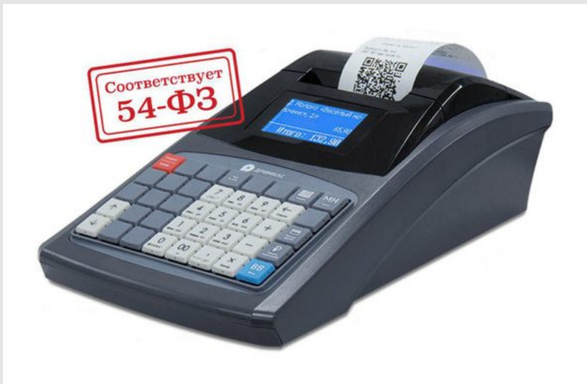
ККТ Дримкас Ф

На чеке печатается вся необходимая информация. Дополнительные параметры могут быть запрограммированы через специальную программу. Имеется функция отправки электронной копии чеков на указанный на почту или абонентский номер клиента (они должны вноситься вручную). Кассовая программа обладает следующими функциональными возможностями: