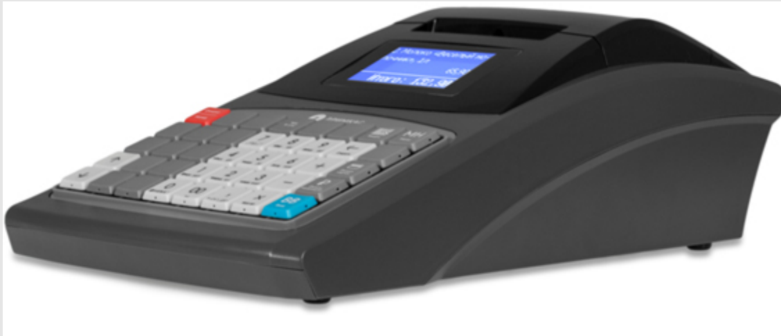
Аппарат в работе